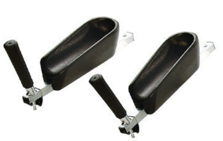
Упоры для рук и локтей