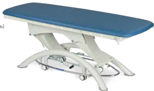
Смотровой стол Capre E1