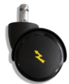
50mm ESD, mustat (sähköä johtavat)

*) Aktivoi istujaa ja vähentää selän väsymistä, jolloin erillistä kulmansäätöä ei tarvita. Pilatesominaisuudella varustettu työtuoli mukailee istujan liikkeitä lisäten kurotuspituutta ja vähentäen rintarangan kuormitusta.