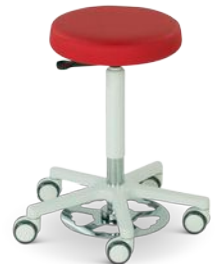
Valkoinen ristikko ja pyörät