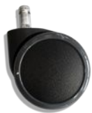
Vakio 65mm, musta (lisävaruste: valkoinen)