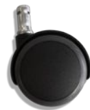
50mm istuttaessa lukittavat pyörät, mustat