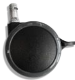
65mm lukittavat, mustat tai valkoiset