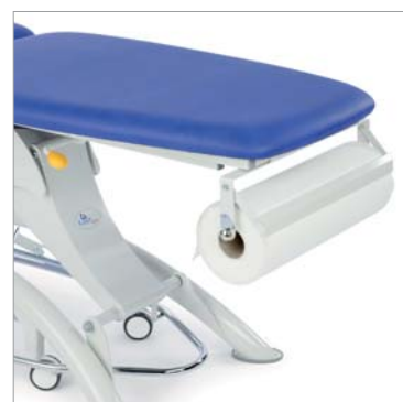
tillval CA110, R